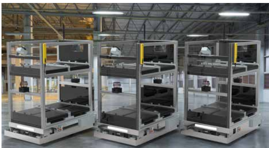
Illustrationsbild – exempel